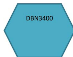
Abbildung 6: Beispiel für Codierung der Mikroplättchen.

Eine unsaubere Arbeitsweise oder mangelhafte Reinigung der Arbeitsgeräte könnten dazu führen, dass Markierungen haften bleiben und andere Strecken der Region mit dieser Kennung verunreinigt werden (Crosskontamination). Eine Zuordnung zum Tatort könnte den