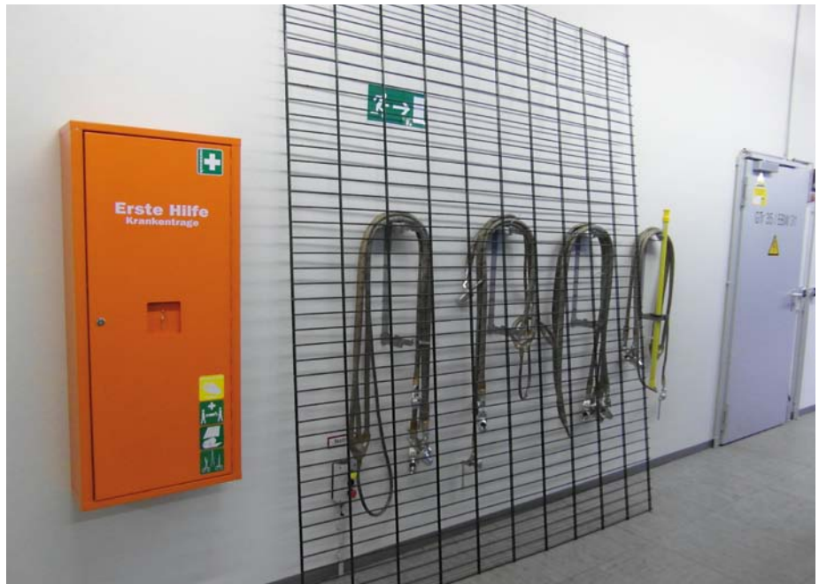
Abbildung 2: Werden die Erdungsvorrichtungen benötigt, steht das Zaunfeld entweder vor der „Ersten Hilfe“ oder vor dem Notausgang.

Deutliche Anzeichen für beginnende Unsicherheiten, welche von den Mitarbeitern vor Ort teilweise gar nicht mehr wahrgenommen werden, sind zum Beispiel: Lagerung von Material in elektrotechnischen Anlagen; schlampige Führung von Betriebsunterlagen, Freigabeformularen und Schaltgesprächen; ungesicherte Zugänge zu abgeschlossenen elektrotechnischen Betriebsräumen; verschlossene oder defekte Notausgangstüren; allgemeine Unordnung. Ein außenstehender Fachmann ist innerhalb kürzester Zeit in der Lage, solche Mängel zu erkennen und sich die folgenden Fragen zu beantworten: