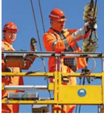
Unser Titelbild: Hubarbeitsbühnen- Instandhaltungsfahrzeug für Oberleitungsanlagen Baureihe 711.1 im Einsatz bei der Instandhaltung von Fahrleitungsanlagen der DB Netz AG im Raum Nürnberg.

zuerst geht es in diesem Heft um Unternehmerverantwortung und damit verbunden, um die Delegation von Aufgaben des Unternehmers im elektrotechnischen Betrieb. Der erste Beitrag richtet sich aber nicht nur an „den Unternehmer“, sondern an alle, die innerhalb der Delegationkette tätig werden – bis hin zur Elektrofachkraft vor Ort (Seiten 3 bis 6).