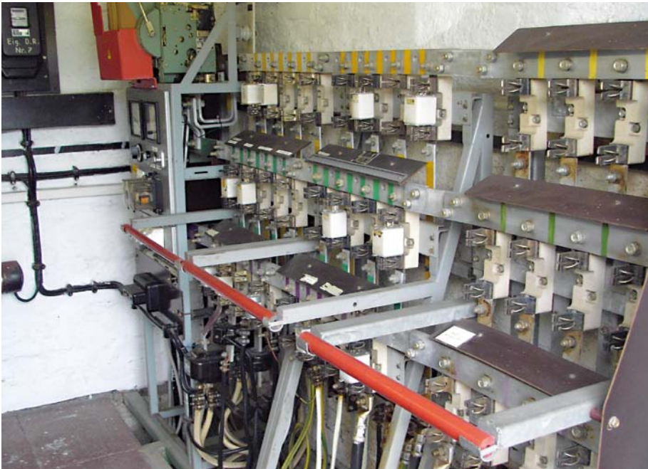
Abbildung 1: Altanlage.

Die beiden vorstehenden Aspekte der Delegation der Unternehmerpflichten werden aus Sicht des Autors in vielen Betrieben mehr oder weniger gut erfüllt, vor allem auch dokumentiert. Hier gibt es eine eingespielte Praxis, die zum Teil auch auditiert wird. Einen erheblichen Interpretationsspielraum bietet aber sehr oft der dritte Gesichtspunkt, die