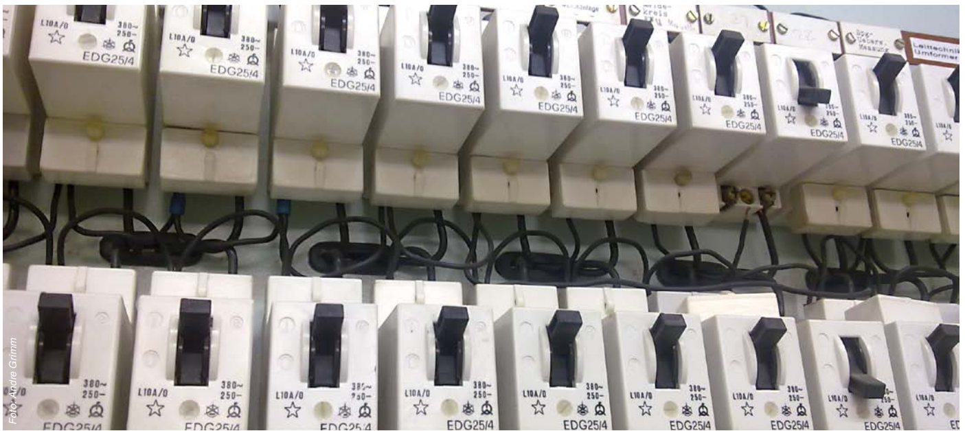
An allen Betätigungselementen muss der teilweise Berührungsschutz gewährleistet sein, was in dieser Abbildung nicht voll umfänglich gegeben ist.