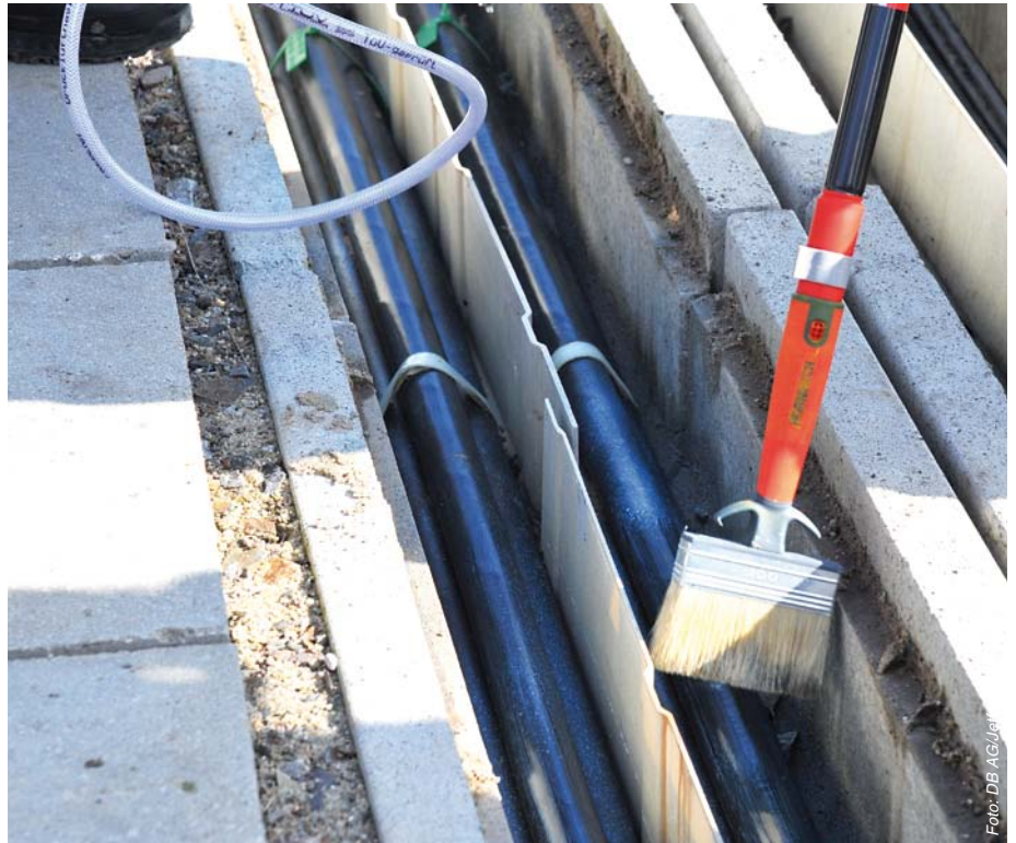
Abbildung 3 und 4: Aufstreichen oder aufsprühen ist für die Wirkung unerheblich.

Ermittlungsbehörden dadurch erschwert oder gar unmöglich gemacht werden.