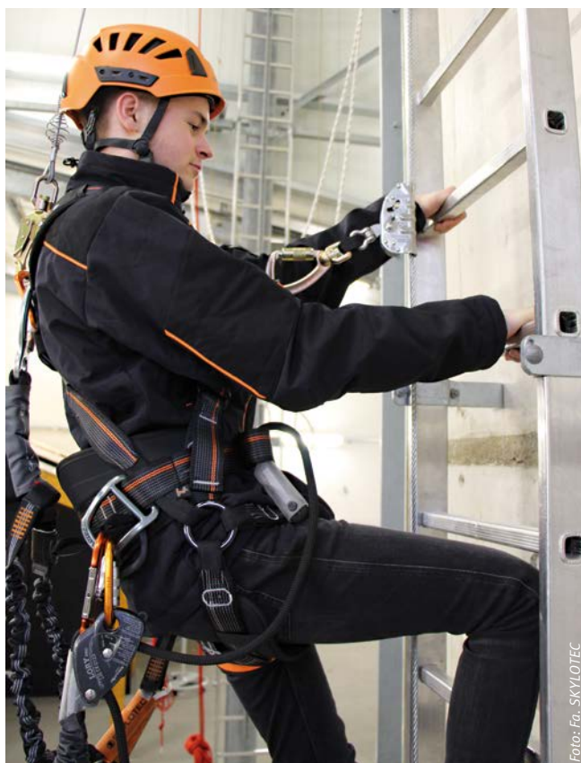
Abbildung 1: Auffangsystem mit einem Steigschutz- läufer (Auffanggerät mit Falldämpfer)

Viele wertvolle Hinweise zu den genannten Komponenten der PSAgA und das Prinzip der grundsätzlichen Vorgehensweise bei