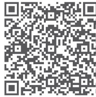
QR-Code für UVB-Publikation 9321

diesen Arbeiten können können der UVB-Publikation 9321 „Verwenden Persönlicher Schutzausrüstung gegen Absturz (PSAgA) – Auffang- und Haltesysteme mit Falldämpfer – Handlungsanweisung für Führungskräfte“ entnommen werden.