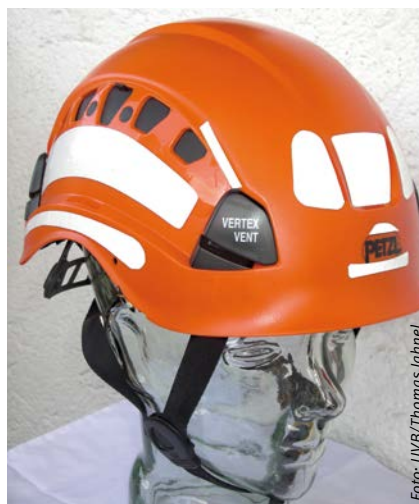
Abbildung 3: Schutzhelm mit Gabelkinnriemen

zum Schutz vor Kälte, UV-Strahlung oder Fremdkörpern.