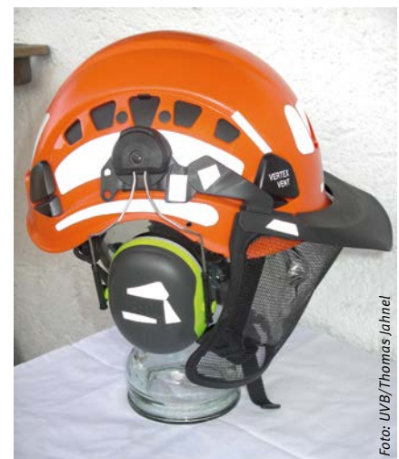
Abbildung 4: Schutzhelm mit Zubehör

Abhilfe schaffen kann ein sogenannter UV-Indikator auf der Helmschale, der von