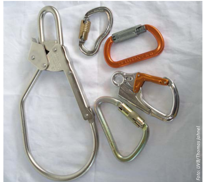
Abbildung 2: Selbstschließende und selbstverriegelnde Karabinerhaken

Früher war das zeitgleiche Tragen von Augen- und Gehörschutz mit dem Helm häufig nur eingeschränkt möglich oder mit einer starken Minderung des Tragekomforts verbunden. Auch wurde der Helm dadurch zunehmend unhandlich und voluminöser. Neue Schutzhelme können häufig unterschiedliche Schutzbrillen, Visiere, Kapselgehörschützer, Sehhilfen sowie Sprechgarnituren für Funk oder Telefon integrieren (Abbildung 4). Für manche Helmmodelle gibt es weiteres sinnvolles Zubehör, zum Beispiel Reflexstreifen, Stirnlampen für Nachtarbeiten, variable Lüftungsschlitze sowie isolierte Winter- oder Nackenschürzen