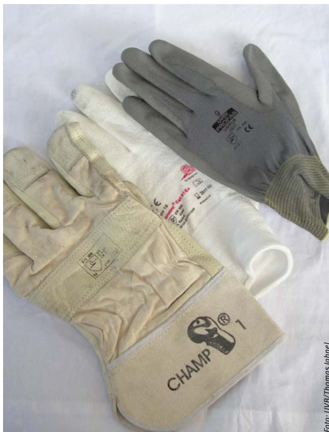
Abbildung 5: Geeignete Arbeits- und Schutzhandschuhe für den Höhenarbeiter

Nur wenn alle diese Regelungen berücksichtigt werden, ist ein Maximum an Akzeptanz und Sicherheit bei dieser personenbezogenen Maßnahme erreichbar. Zu ergänzen sind diese Vorgaben auf jeder Arbeitsstelle mit dem Vorhalten eines Rettungsgerätes sowie dem Vorhandensein von Erste-Hilfe-Personal und Erste-Hilfe-Material.