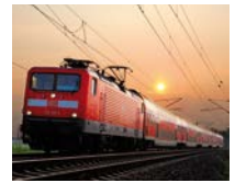
Unser Titelbild: Doppelstockwagen mit Ellok der Baureihe 112 in der Abenddämmerung