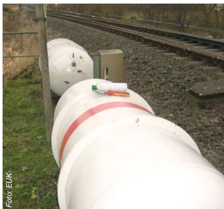
Abbildung 1: Flüssiggastanks zur Beheizung von Propangas-Weichenheizungen liegen in unmittelbarer Gleisnähe.