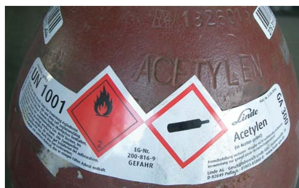
Abbildung 5: Gefahrgutaufkleber für Acetylen.