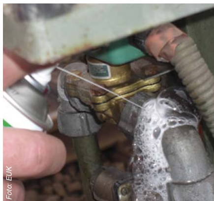
Abbildung 2: Dichtheitsprüfungen mit schaubildenden Mitteln zeigen mögliche Undichtheiten.