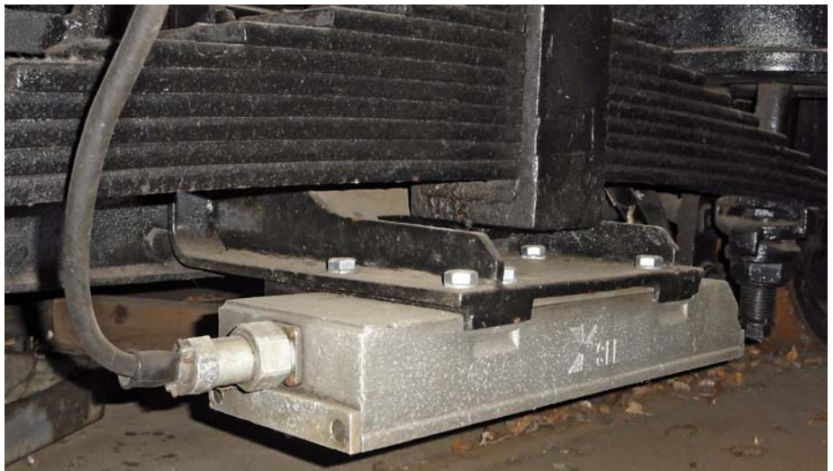
Abbildungen: PZB am Fahrzeug (oben) und am Fahrweg (unten)

Die Bekanntgabe 11 zur Richtlinie 408 folgt dann planmäßig zum 9. Dezember 2012, wie auch im regelmäßigen Fortbildungsunterricht (FIT) bereits behandelt wurde. ■