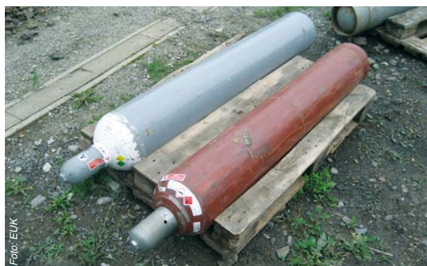
Abbildung 3: Die Gasflaschen (Sauerstoff und Acetylen) sind gegen Fortrollen gesichert. Sofern die Gasflaschen ausreichend gegen mechanische Beschädigung und Erwärmung geschützt sind und keine Stolperstellen darstellen, ist dies kurzzeitig in Ordnung. Flüssiggas jedoch muss stehend gelagert werden.

Ausnahme: Flüssiggasflaschen müssen stehend gelagert werden.