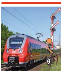
Unser Titelbild: ET 442 bei der Einfahrt nach Hirschaid.

Zum 1. Dezember 2012 wird die Eisenbahn-Bau- und Betriebsordnung geändert. Nach einer kurzen Einführung werden in dem Beitrag ab Seite 3 die Änderungen, die Hintergründe und die Auswirkungen dargestellt.