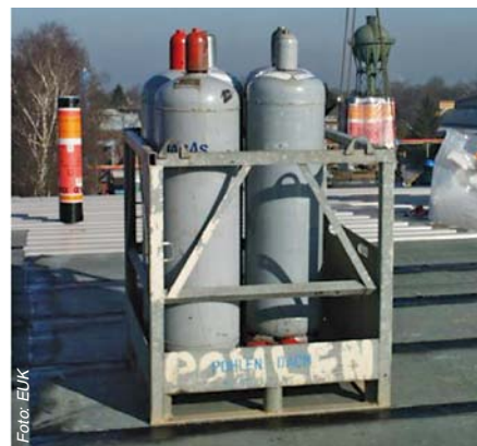
Abbildung 4: Die stehende Lagerung in einer Transportbox ist eine beispielhaft gute Lösung für Baustellen.