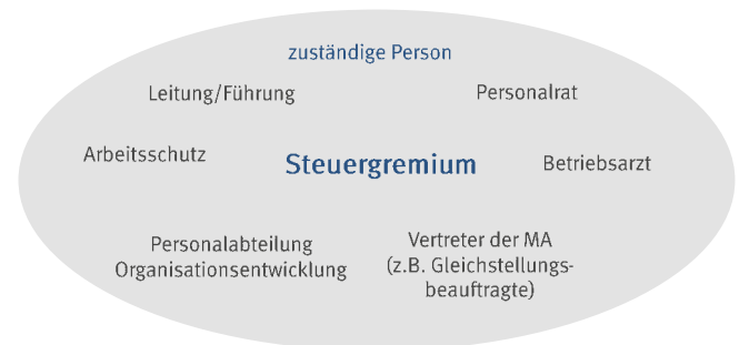
Steuergremium Gesundheit – alle Beteiligten an einem Tisch

Gründen Sie ein Steuergremium (Arbeitskreis Gesundheit) mit einer zuständigen Person: