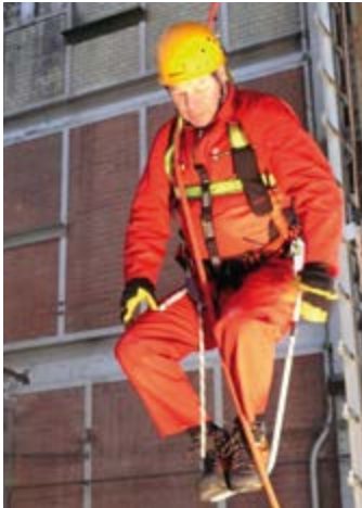
Abb. 3 Halteseil mit Längeneinstell- vorrichtung