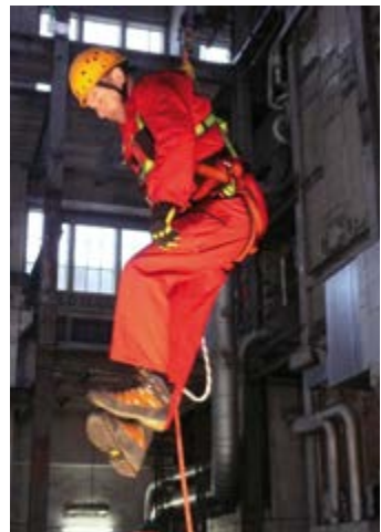
Abb. 8 Be- und Entlastung der Füße ohne Hilfsmittel