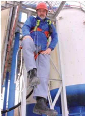
Abb. 4 Entlastung durch Stemmen eines Fußes in eine Trittschlinge

Zeiten bis zum Eintreten des Hängetraumas lassen sich nicht allgemeingültig angeben. Es wurden Hängeversuche durchgeführt, um zu ermitteln, nach welcher Zeit die Symptome des Hängetraumas auftreten. Von gesunden Freiwilligen bekamen einige bereits nach wenigen Minuten bewegungslosem Hängen in einem Sitzgurt erste Anzeichen für ein mögliches Hängetrauma. Deshalb sollte die betroffene Person möglichst schnell aus der freihängenden Position befreit werden.