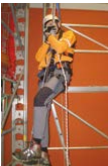
Abb. 5 Anwendung der Prusikschlinge