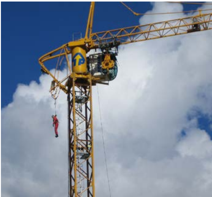
Abb.1 In einem Auffanggurt frei hängende „hilflose“ Person

Bei bestimmungsgemäßer Benutzung von persönlichen Schutzausrüstungen gegen Absturz ist das Auftreten eines Hängetraumas sehr unwahrscheinlich. Dafür ist eine sachgerechte Auswahl, das exakte Anpassen des Gurtes und die Durchführung eines Hängetests (s. DGUV Regel 112-198 „Benutzung von persönlichen Schutzausrüstungen gegen Absturz“) unbedingt erforderlich.