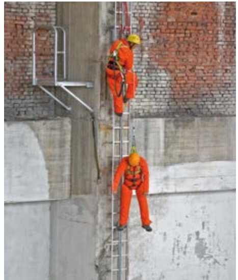
Abb. 10 Rettung einer verunfallten Person von einer Steigschutzeinrichtung

Einzelheiten zu möglichen Rettungsmaßnahmen bzw. deren Planung enthält die DGVV Regel 112-199 „Retten aus Höhen und Tiefen mit persönlichen Absturzschutzausrüstungen“.