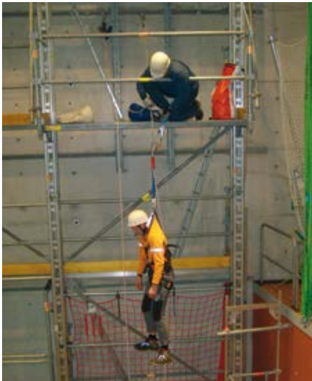
Abb. 9 Rettung einer frei hängenden Person mit Abseilgerät mit Rettungshubeinrichtung

Die beiden folgenden Abbildungen zeigen beispielhaft Rettungsaktionen für eine frei im Seil hängende Person und eine durch eine Steigschutzeinrichtung aufgefangene Person.