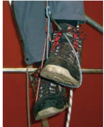
Abb. 7 Abwechselnde Be- und Entlastung der Füße in den Prusikschlingen

Sollte kein Halteseil mit Längeneinstellvorrichtung oder keine Prusikschlinge zur Verfügung stehen, kann sich die frei im Seil hängende Person wechselweise jeweils mit einem Fuß fest auf den anderen Fuß treten. Dabei wird der untere Fuß kräftig mit den Zehen nach oben gezogen. Dies hält allerdings nur für eine sehr kurze Zeit (wenige Minuten) den Rückfluss des Blutes aus den unteren Extremitäten im Gang.