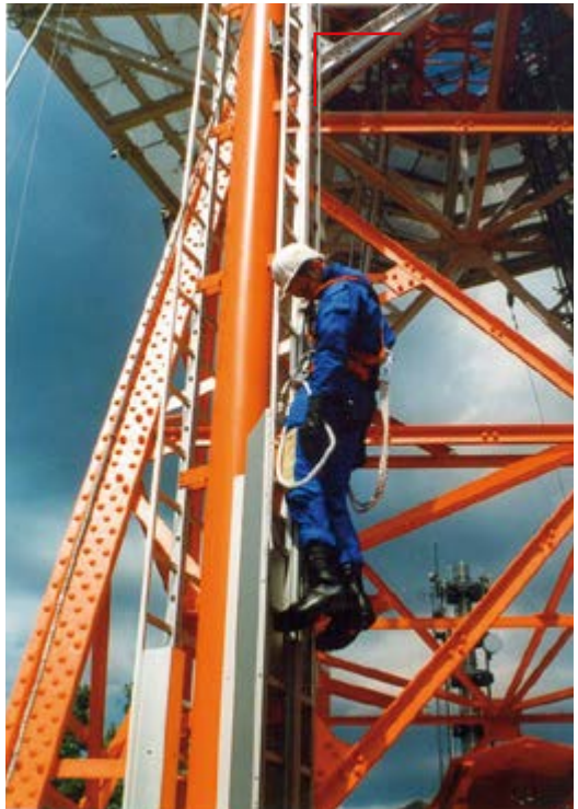
Abb. 2 In einer Steigschutzeinrichtung bewegungslos hängende Person